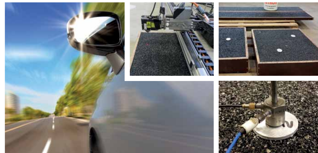
Inzet: Textuurmeting bij akoestisch adviesbureau M+P. Rechtsboven: Overzicht geproduceerde proefstukken voor de pre-screening fase. Rechtsonder: Impedantiemeting bij akoestisch adviesbureau M+P.