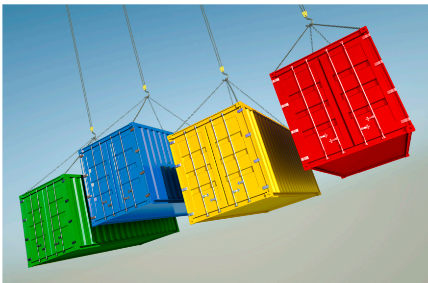
Canaux Vert, Bleu, Jaune et Rouge

Profiler® conseillera un canal de dédouanement en adéquation avec les interventions recommandées.