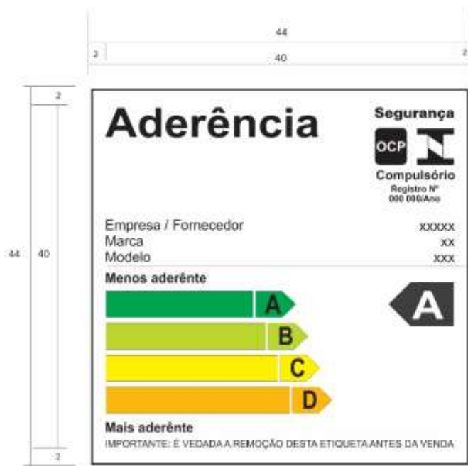
Figura 2 – Formato e dimensões do Selo de Identificação da Conformidade para utensílios com revestimentos antiaderente.

1.2.1 A Figura 2 deve ser impressa em fundo branco e com texto na cor preta. As faixas de eficiência devem obedecer ao padrão de cores CMYK (ciano, magenta, amarelo e preto), conforme Quadro 1 ou no padrão de cores RGB (vermelho, verde e azul) conforme Quadro 2: