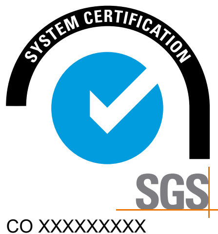
Cambios en el color y el diseño del Sello