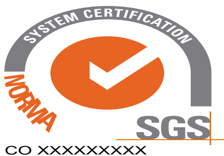
Distorsión en su proporción horizontal