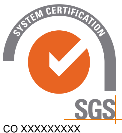
Eliminación de elementos o partes del Sello