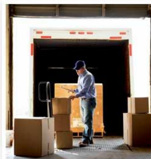
SPEED TO MARKET