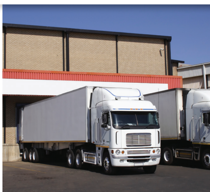
SEGURANÇA DO TRANSPORTE