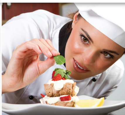
ALÉM DA EXCELÊNCIA