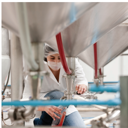
SEGURANÇA DO ALIMENTO